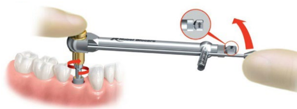
Рисунок D. Выкручивание имплантата путем его вращения против часовой стрелки с помощью ручного хирургического динамометрического ключа Manual Torque Wrench Surgical

Внимание! Чрезмерное усилие фиксации, прикладываемое к инструменту для извлечения имплантатов Implant Retrieval Instrument, может привести к повреждению или перелому кости.