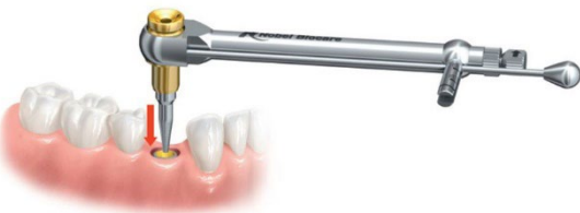
Рисунок В. Установка инструмента для извлечения имплантатов Implant Retrieval Instrument в имплантат

Примечание. Для извлечения имплантатов с внутренним трехканальным соединением в ситуациях, когда повреждено соединение, можно использовать втулку для извлечения имплантата Implant Rescue Collar и держатель Handle, чтобы упростить извлечение имплантата (подробную информацию о держателе Handle к втулке для извлечения имплантата см. в инструкции по применению компании Nobel Biocare IFU1090) (рисунок С).