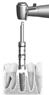
Рисунок F. Установка трепана Trephine Drill поверх имплантата