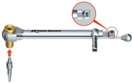
Рисунок А. Установка инструмента для извлечения имплантатов Implant Retrieval Instrument в ручной хирургический динамометрический ключ Manual Torque Wrench Surgical с помощью переходника ручного динамометрического ключа Manual Torque Wrench Adapter