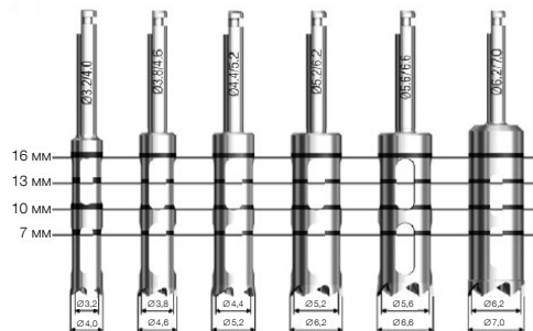
Рисунок Е. Маркировка глубины на трепанах Trephine Drill

Примечание. Отметки глубины соответствуют фактическим размерам в миллиметрах. Чтобы предотвратить чрезмерное расширение остеоотомического отверстия, убедитесь, что выбранный трепан Trephine Drill ненамного превышает диаметр имплантата.