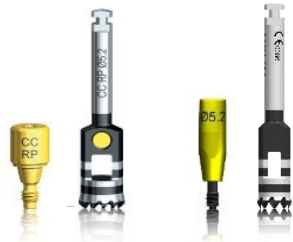
Таблица 1. Костные мельницы Bone Mill и совместимые направляющие для костных мельниц Bone Mill Guide, системы имплантатов и отвертки